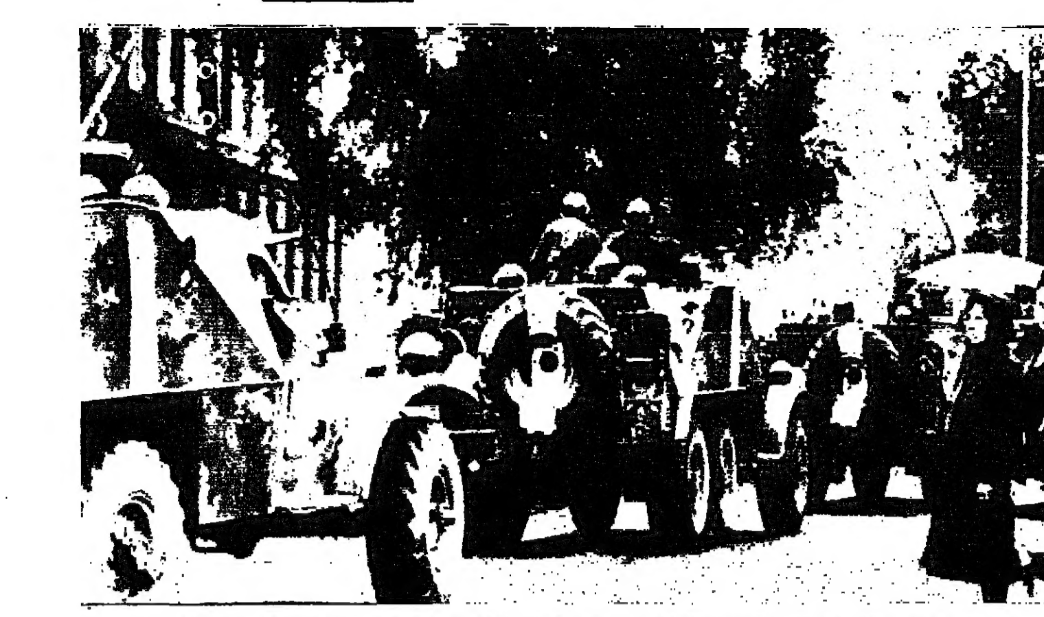
المدنات السوفياتية تخفق شوارع العاصمة التشكية في دوريات مستمرة الاحتلال السوفياتي «صورة خاصة بالسنون من البرينديرس»

ساينون - رويتر - حذر الوزراء الصيني ان الشيوعيين اكثر من حين موقفا بين مدن وشماتة عسكرية في فيتنام الجنوبية ووجه الرئيس نيوين فان نيو نساء دراماتيكا نأديه فيتنام الشمالية «حمام دم» «حمام» اخر. ووقع قتال مرير في اعقاب عدس من هجمات نورا-فيتكونغ الابن استخدموا الصواريخ ومدافع الموزن لتصف اهداف تقع معظمها في المناطق الشمالية من فيتنام الجنوبية. وحاول القوار الاستيلاء على محطة الالات في داغ التي تضم القاعدة العسكرية الجوية الفسخة في شمال البلاد وانقرا الرعب في بعض اجزاء الدينة نتيجة لقران القانصة. واصيبت مفكرة تبليغ صادرة عن محكمة العاصمة القبرية القاتي / الشهر بنك من القنصل اصلا وسكان رام الله واخر محل اقلية الاتية. يقضي حضورك الى هذه المحكمة يوم الازمة الواقع في 19-1-1968 الساعة التاسعة صباحا للقر في الدعوى اساس 181-132 المرفوعة عليك من قبل الدينة تما بنت جيبس محمود الجزائري من يافا اصلا وسكان عمان يطلب نفقة زوجة «فاذا لسم تحضر في الوقت المعلن ولم ترسل وتلك وتم تد معة مشروعة كسرى الدعوى بحك غياييا وعليه جرى تبليغك حسب الاصول في 28-1-1968 هـ و 22-1-1968 ق تفلي العاصمة القبرية / المكتب مطلق المحتسب